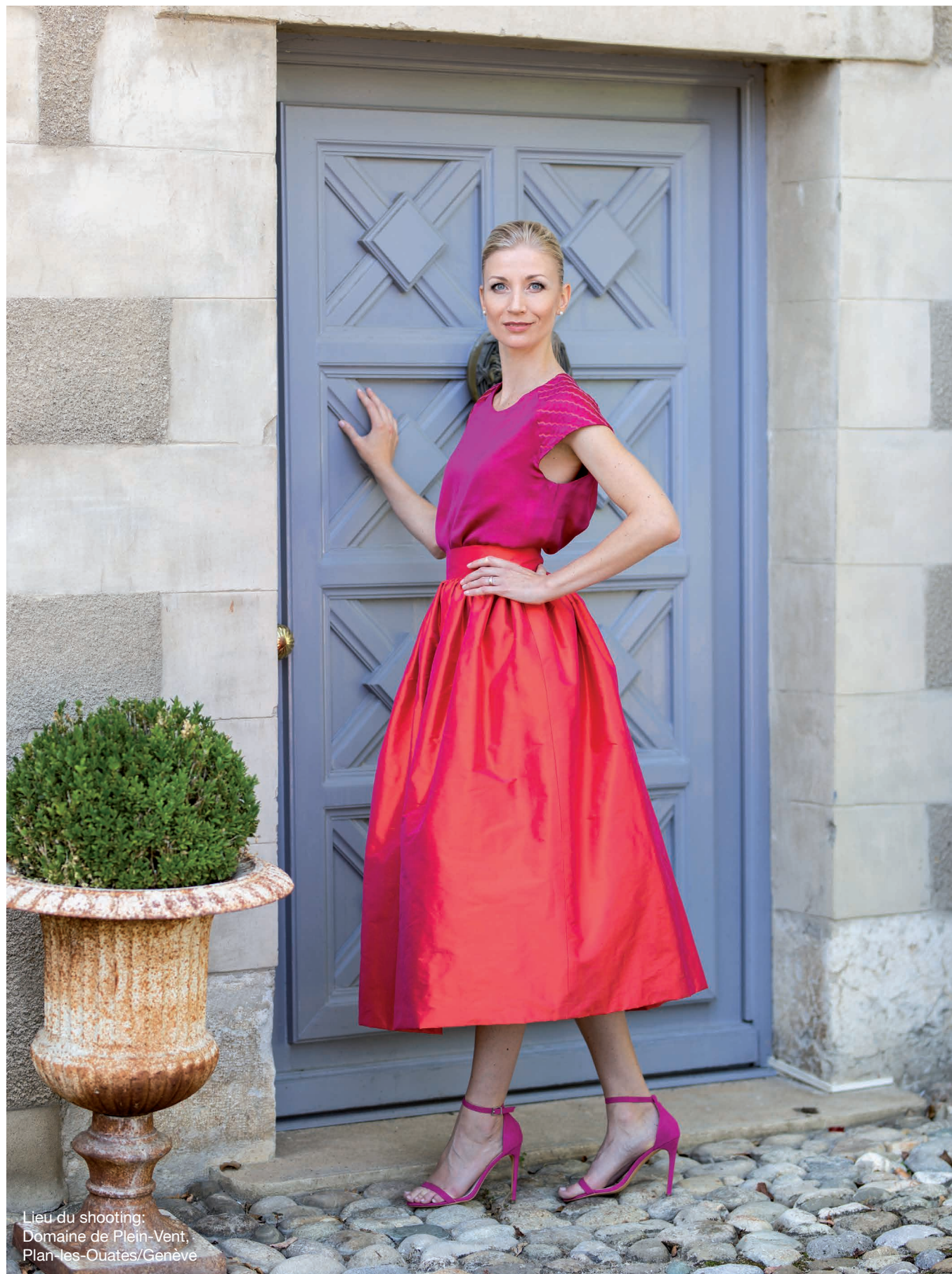
Lieu du shooting: Domaine de Plein-Vent, Plan-les-Ouates/Genève