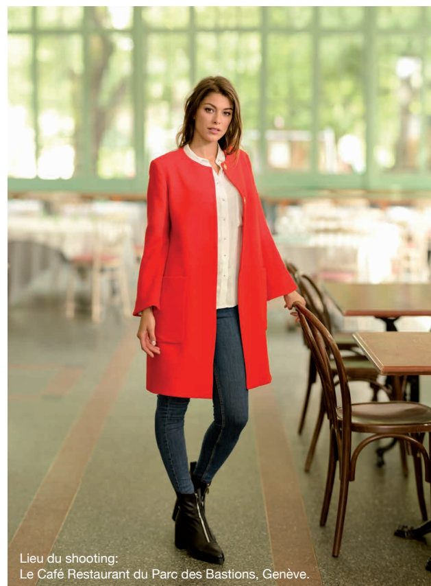
Lieu du shooting: Le Café Restaurant du Parc des Bastions, Genève.

Peu importe que vous recherchiez l'aspect décoratif ou fonctionnel, vous saurez apprécier la précision et la qualité régulière de tous ces points. Avec le modèle 570, vous pouvez aussi créer des combinaisons de points personnelles et uniques.