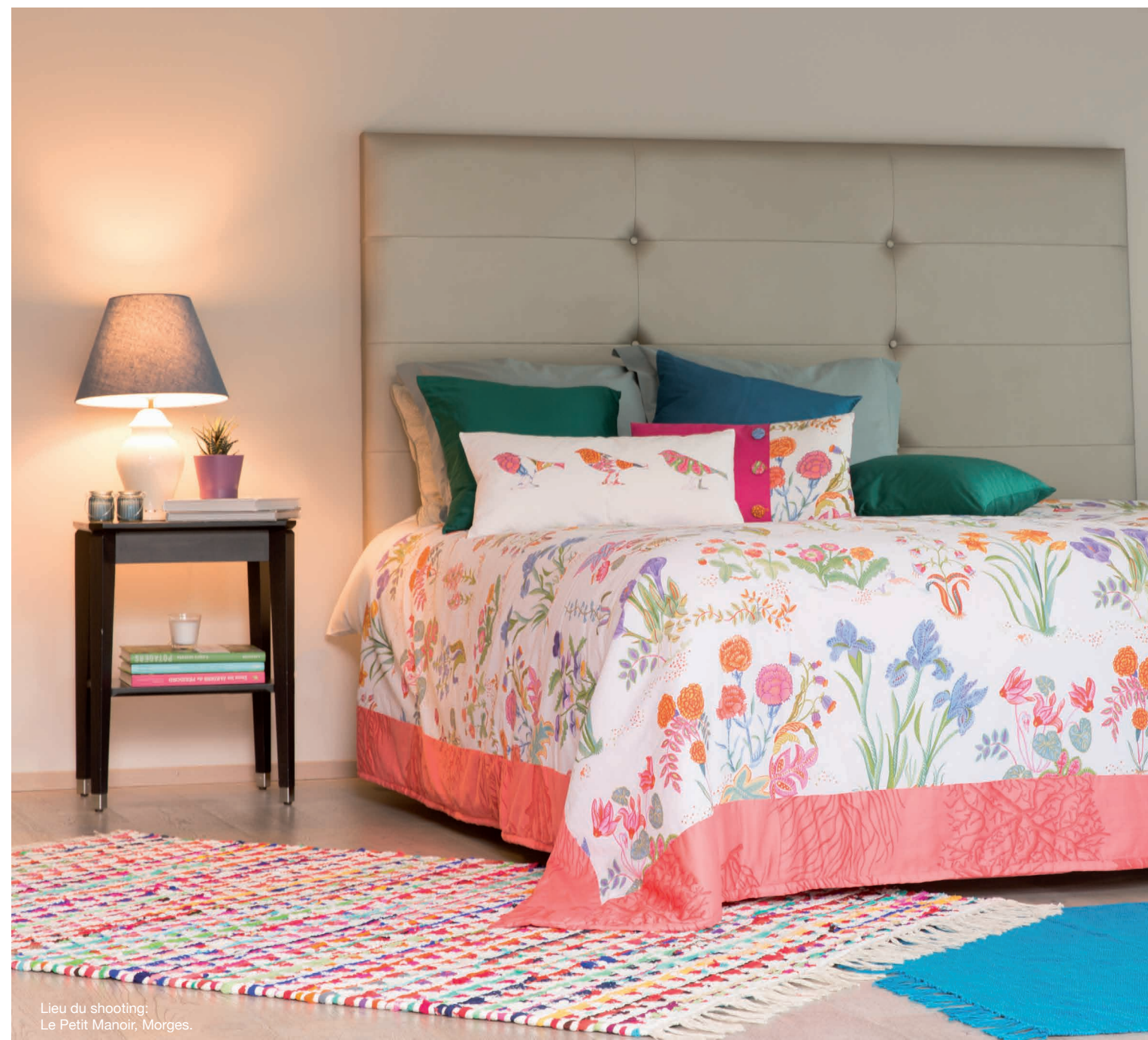
Lieu du shooting: Le Petit Manoir, Morges.

Une couture sans stress avec elna eXperience: De nombreuses fonctionnalités très pratiques rendent vos travaux de couture plus faciles, plus rapides et par conséquent plus agréables.