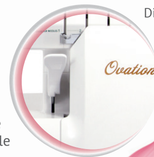
Disposition pratique du releveur de pied presseur

La soie ou les tissus difficiles à travailler arrivent toujours à glisser de la surface de travail au moment inopportun. Ovation vous offre une „troisième main“ avec la genouillère. Vos deux mains restent ainsi sur le tissu pendant que votre genou modifie la position du pied-de-biche. Le passage sous le bras plus large offre plus de place pour des projets volumineux et peut être combiné avec la table rallonge en option. Ainsi tout reste à sa place !