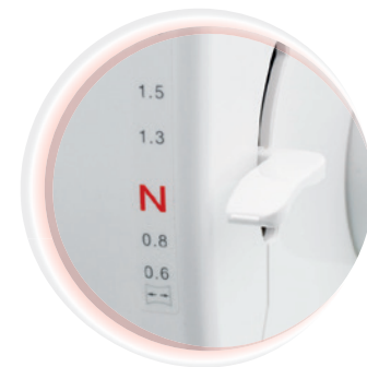
Entraînement différentiel Réglage individuel de la trajectoire de l'entraînement du tissu pour éviter la formation de fronces indésirables en travaillant le tissu.