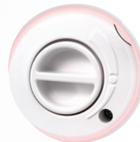
Réglage individuel gradué de la pression du pied presseur