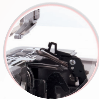
Boucleur surdimensionné avec boucleur auxiliaire intégré