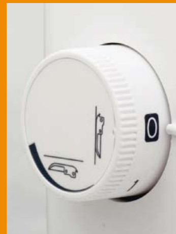
Bouton de réglage de l'épaisseur de la matière