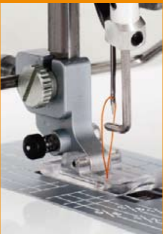
Système tire-fil spécial