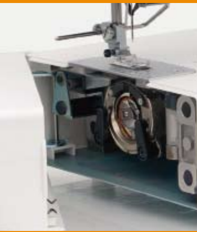
Crochet CB robuste