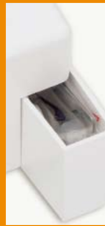
Compartiment accessoires intégré