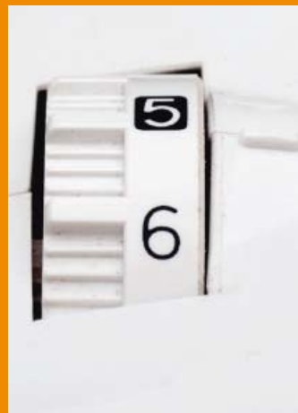
Réglage de pression du pied de biche avec affichage