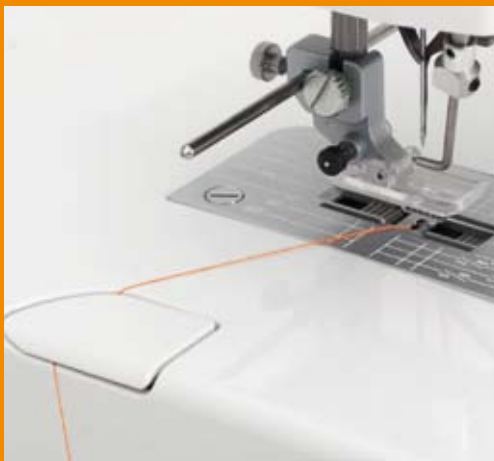
Couteau de fil intégré