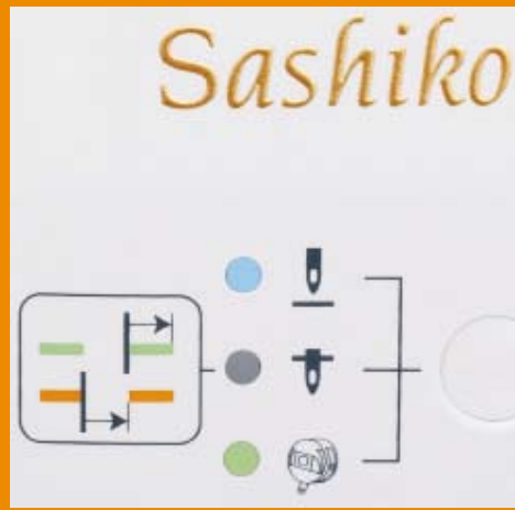
Touche de fonction pour position haute / basse de l'aiguille