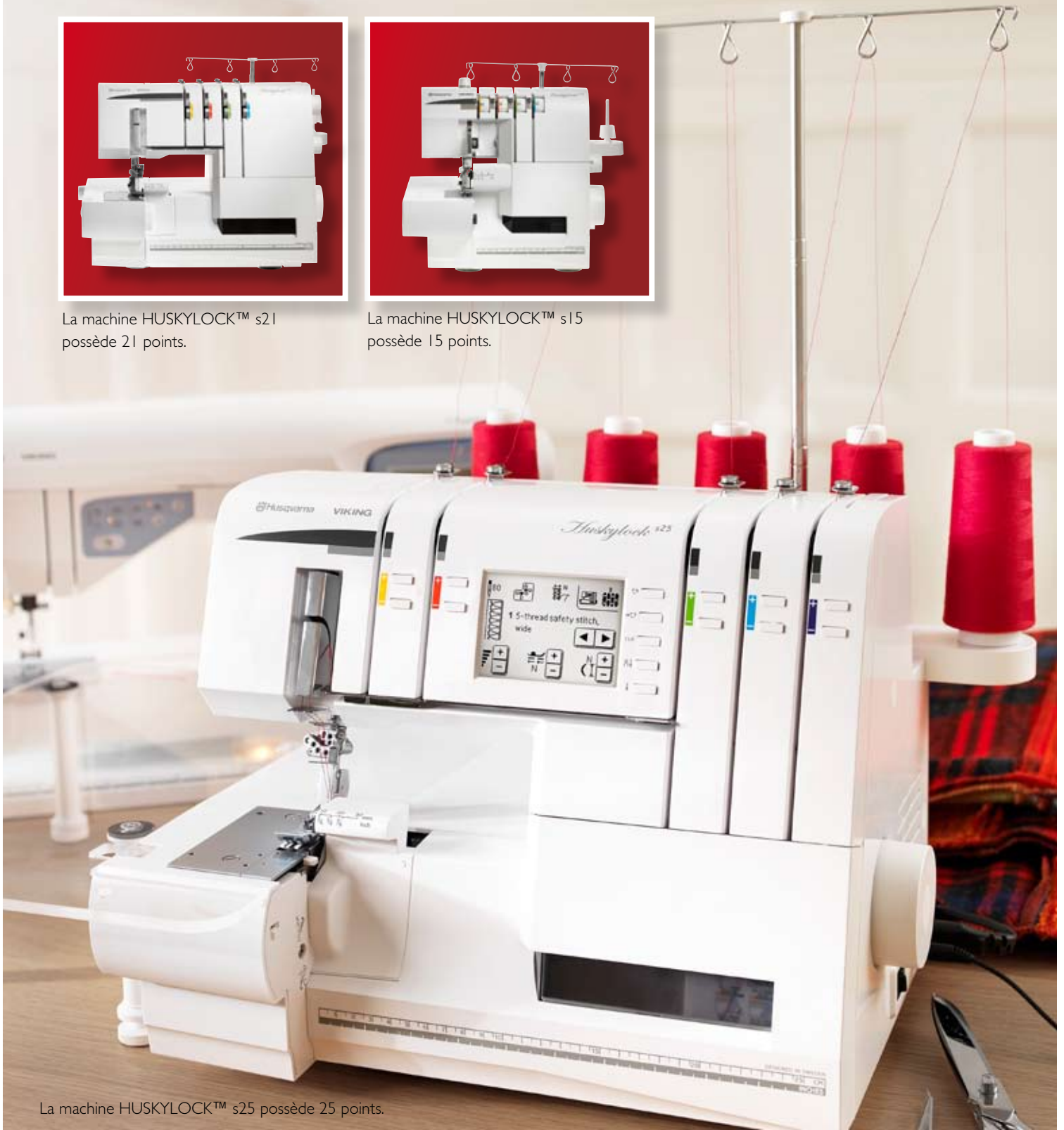
La machine HUSKYLOCK™ s25 possède 25 points.

Les vêtements et les éléments de décoration d'intérieur éblouissants sortent totalement de l'ordinaire. Les surjeteuses HUSKYLOCK™ sont innovantes aussi bien au niveau des points de couture intérieure que des ourlets extérieurs et vous inspireront pour la création de projets uniques. Débutante dans le surjet ou passionnée expérimentée, la gamme de surjeteuses HUSQVARNA VIKING® vous offre la solution !