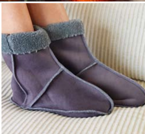
Chaussons confortables avec points overlock.