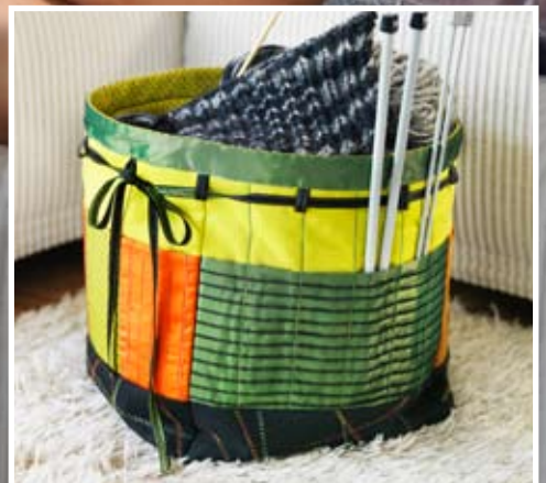
Panier à tricot avec points overlock décoratifs et poches pour les aiguilles.