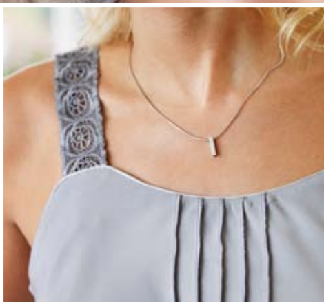
Caraco avec magnifiques nervures en point overlock et bretelles brodées.