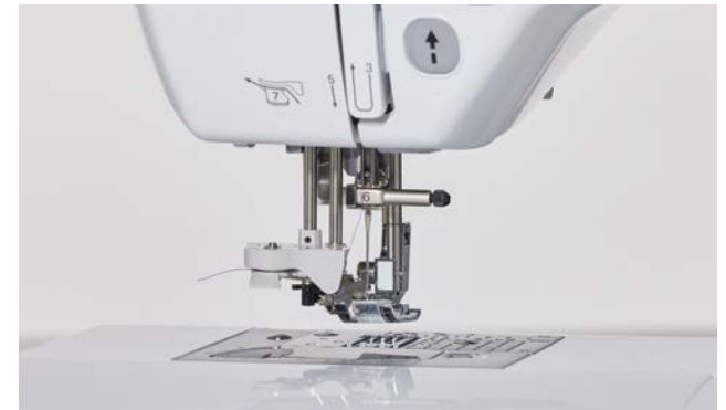
Système d'enfilage de l'aiguille extra-avancé