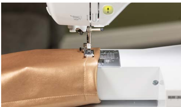
Couture à bras libre