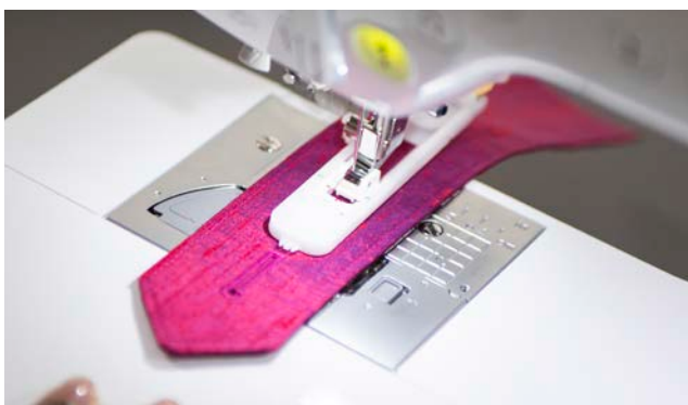
10 styles de boutonnières automatiques en 1 étape