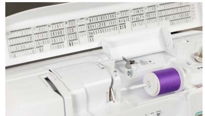
241 points de couture utiles et decoratifs integres