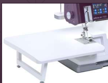
Table de rallonge incluse

Choisissez parmi cinq réglages de vitesse différents, ce qui vous permet de régler la vitesse maximale de couture de votre machine selon vos souhaits, vous laissant ainsi un contrôle total.