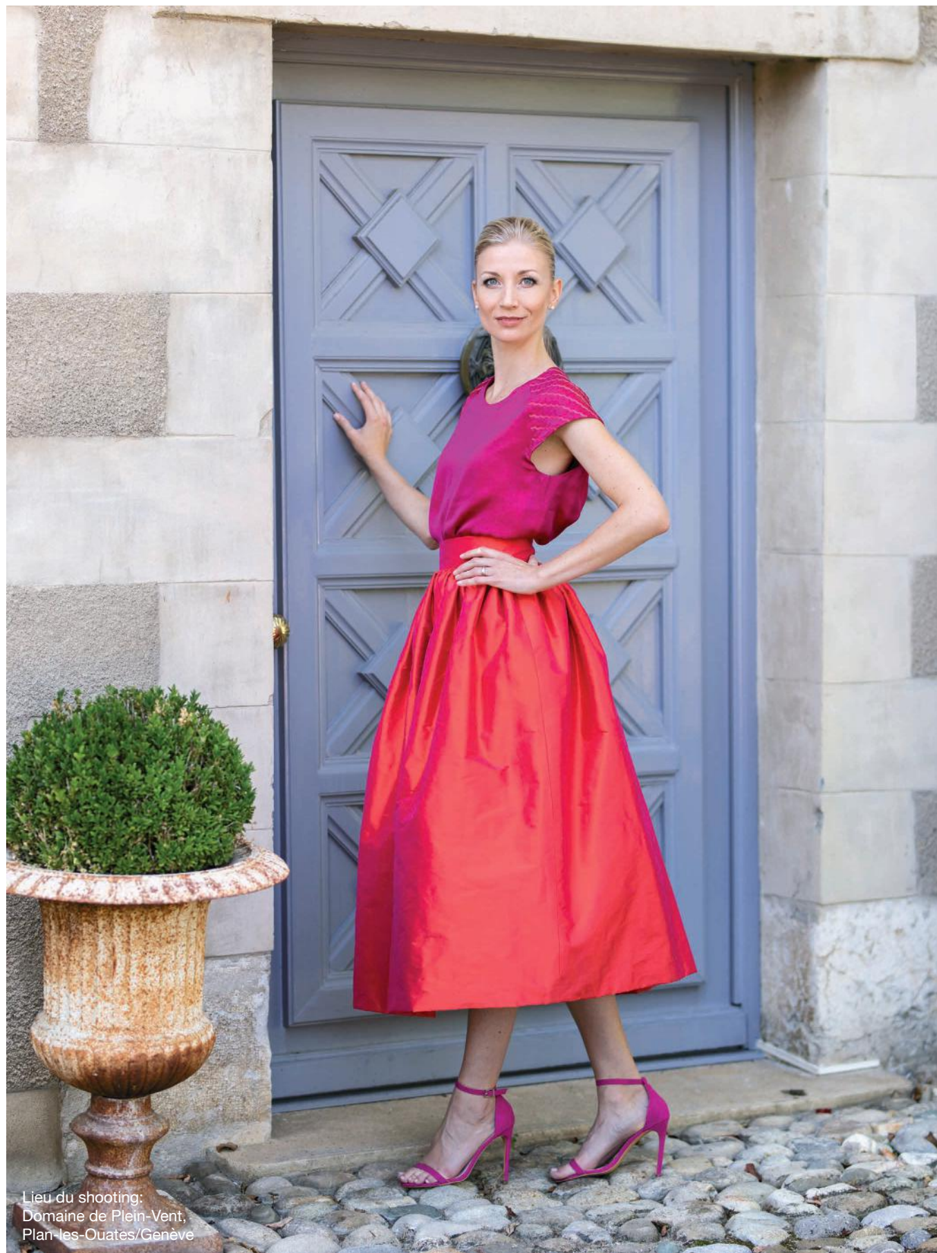
Lieu du shooting: Domaine de Plein-Vent, Plan-les-Ouates/Genève