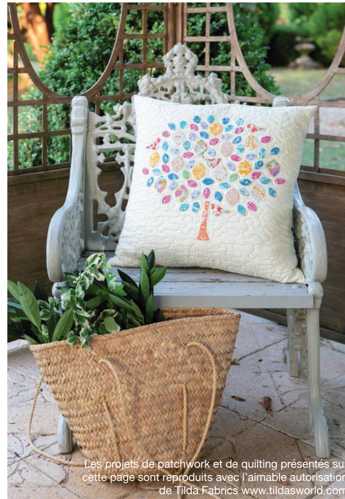
Les projets de patchwork et de quilting présentés sur cette page sont reproduits avec l'aimable autorisation de Tilda Fabrics www.tildasworld.com