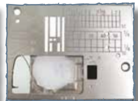
Plaque aiguille point droit