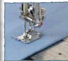
Pied point droit