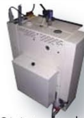
Générateur avec bache (option)